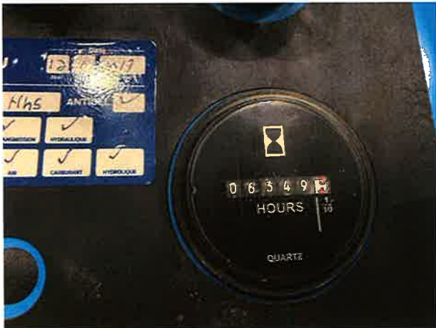
Compteur d'heures / Hour counter