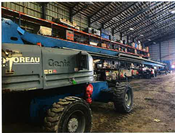
Photo générale / General Picture