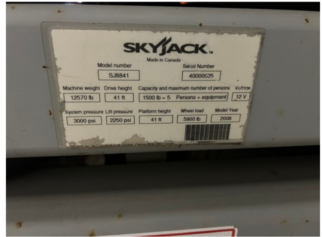
Plaque d'identification / Nameplate