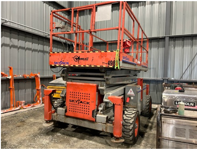
Photo générale / General Picture