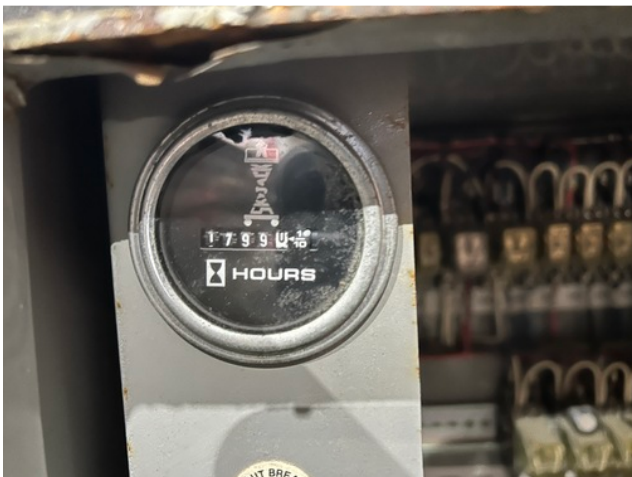
Compteur d'heures / Hour counter